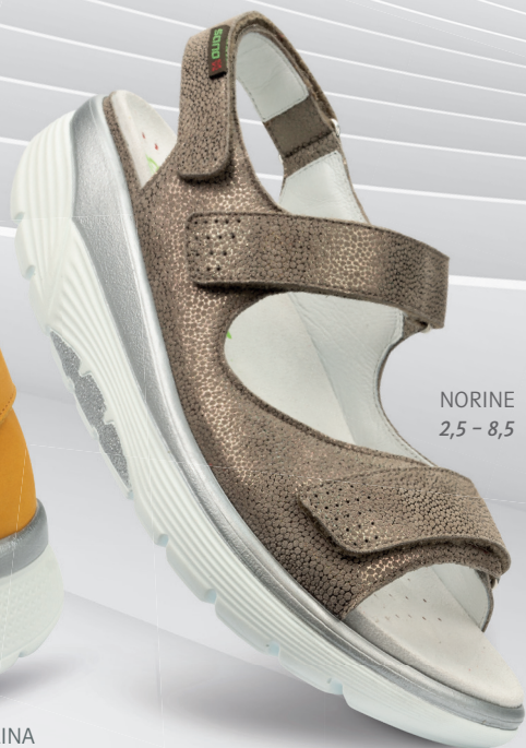
NORINE 2,5 - 8,5