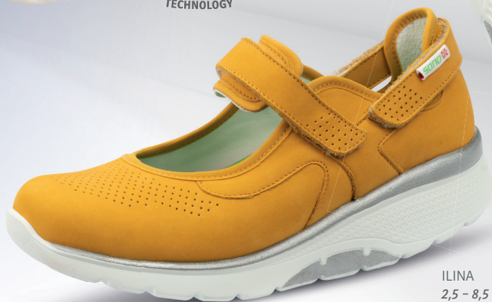
ILINA 2,5 - 8,5