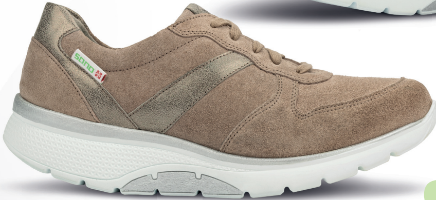
ISALYS 2,5 - 8,5