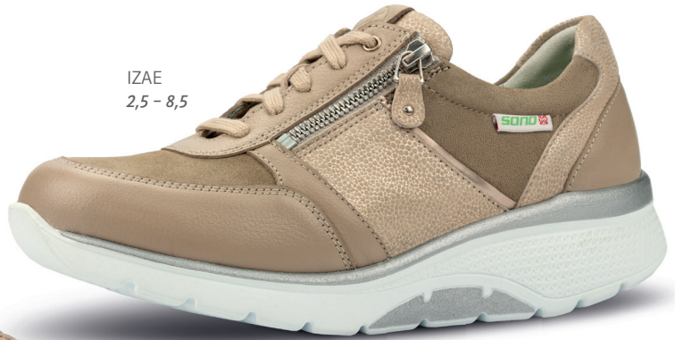
IZAE 2,5 - 8,5